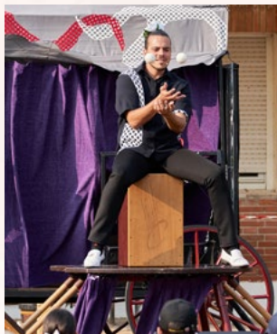
Gerardo Sanz Fotografos